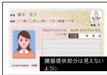
マイナンバーカード