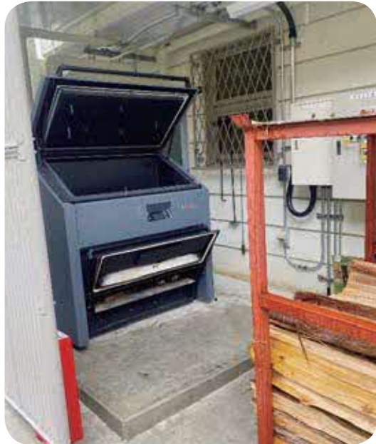
ホテルのせ川に整備された薪ボイラー

「ホテルのせ川」で整備を進めていた木質バイオマスボイラー設備（薪ボイラー）が4月23日に完成し、本格運用を開始しました。村の林業はこれまで、急峻な地形による高い搬出コストや、村内に加工施設がないといった理由から、伐採した木材を山に放置する切捨て間伐を行ってきました。今回、未利用材を熱源として地域内で活用する「地域内エコシステム」を構築し、豊かな森林資源を熱エネルギーとして有効活用することで、二酸化炭素（CO 2 ）の削減と、地域経済の循環創出を目指します。