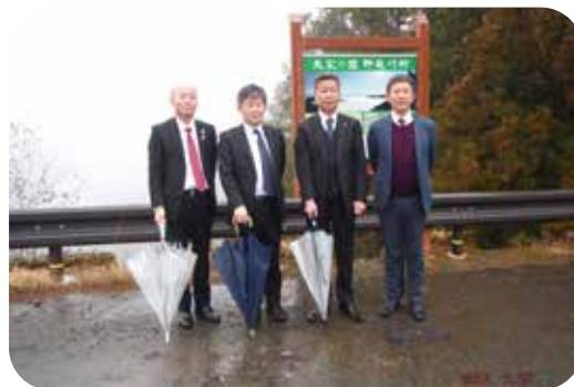
左から 清水副知事 齋藤局長 野迫川村長 河本所長