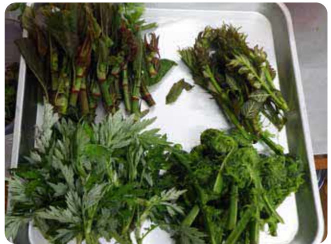
野迫川で採れた山菜