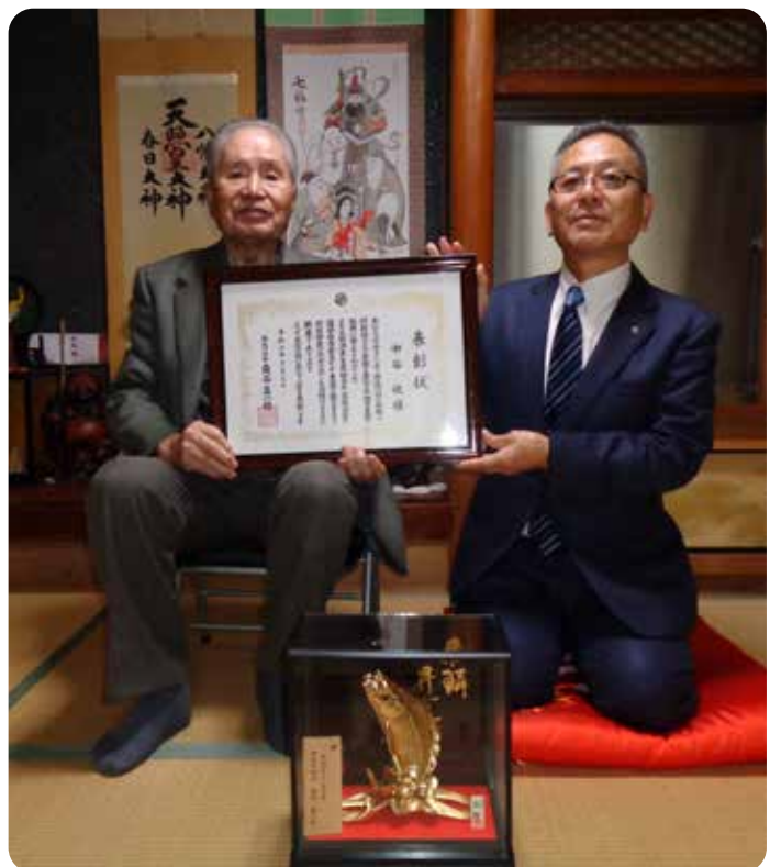
写真撮影のためマスクを外しております。