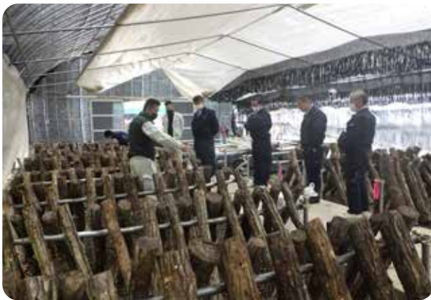
シイタケ栽培施設

視察現場において、産業課長、建設課長から説明を受け実りある視察となりました。今後も村民の生活環境をより良くするために、議会議員として活動して参ります。