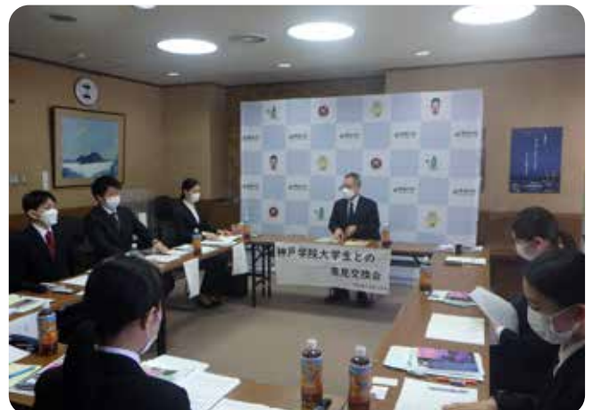
写真撮影のためマスクを外しております。